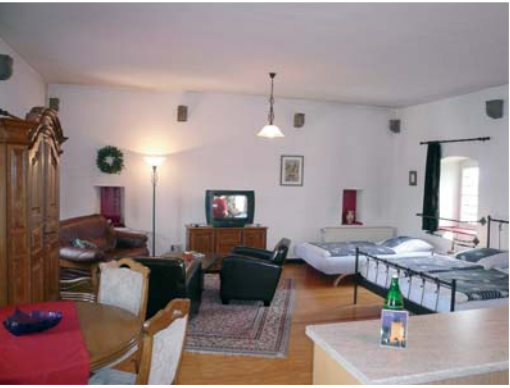
III. Etage (46 m²): Doppelbett Schlafcouch