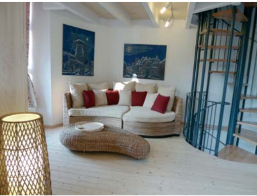
I. Etage: Wohnzimmer