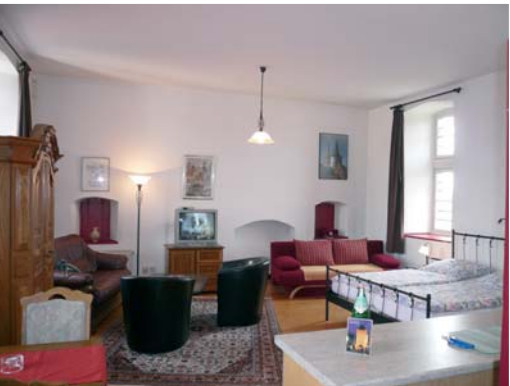
II. Etage (40 m²): Doppelbett Schlafcouch