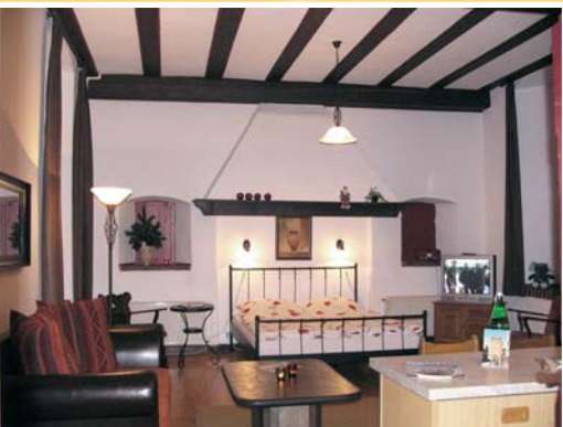
I. Etage (36 m²): Französisches Bett Schlafcouch