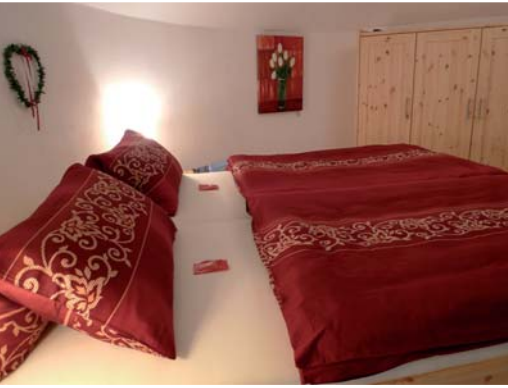
II. Etage: Schlafzimmer